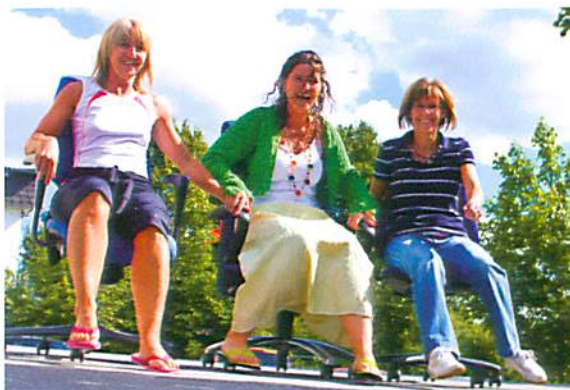
Wir bringen Ihre Therapie ins Rollen - das Planungs-Team

... Aber auch alles andere als leicht. Bei der Vielzahl Ihrer Anwendungen müssen wir stets Schweregrad der Erkrankung, Dauer der Anwendung, Material und Therapeuten zu Ihrem Besten koordinieren. Ihre meist 10 - 20 Therapietage erfordern 3 - 5 mal pro Woche je 4 - 6 Stunden Behandlungsdauer bei uns im Medifit.