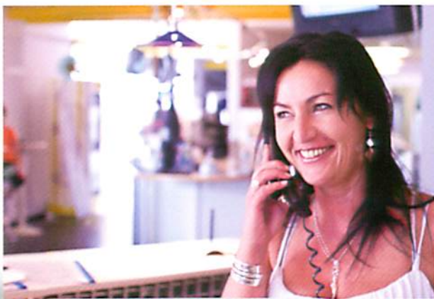
Was können wir für Sie tun?

Die Ambulante Reha als eine Säule der medizinischen Rehabilitation und leistungsstarke Alternative zur stationären Reha ermöglicht eine komplexe, wohnortnahe Behandlung und somit eine schnelle und effektive Wiedereingliederung in den Alltag.