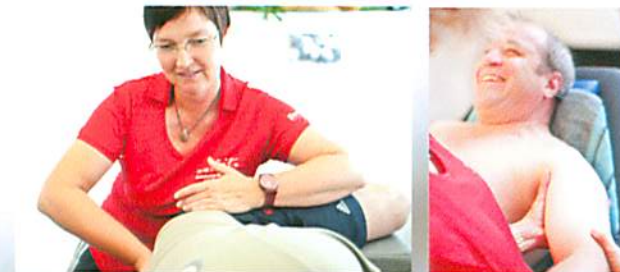
Mit Herz und Hand zum Therapieerfolg

Für jede Therapieform, sei es Physiotherapie, Ergotherapie, Bewegungsbad etc. stehen Ihnen Spezialisten unseres Teams mit Rat und Tat zur Seite. Behandlungspläne werden in den Teambesprechungen an Ihr Befinden und an Ihre Fortschritte angepasst. Die Erfahrung des Teams wird Sie bis zu Ihrem Ziel begleiten. Ein Abschlussgespräch wird das Erreichte dokumentieren. Regelmäßige Termine bei unseren Ärzten gewährleisten Ihnen ein Maximum an Sicherheit für Ihren Therapieerfolg.