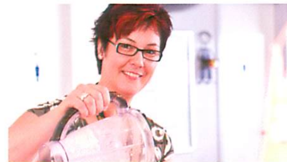
Erfrischung im Bistro

Pausen sind nicht Leerlauf, sondern fördern die Regeneration. Ihr Körper muss die Anforderungen sinnvoll verarbeiten und nicht einfach abarbeiten. Gönnen Sie sich in den Ruhepausen ein Getränk oder einen Snack. Unser Bistro hält stets Geeignetes für Sie bereit. Als Rehapatient wird Ihnen ein Imbiss serviert (ohne Getränke). Sie können unseren Wellnessbereich gerne zur Regeneration nutzen.